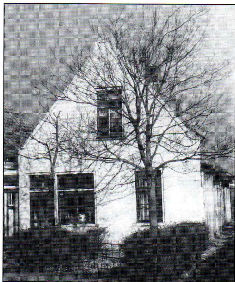
Jan van der Meer start op 2 januari 1952 met een winkeltje in Noordeinde 125. Hij zal er tot 17 april 1956 blijven.

Voor de volledigheid: er waren in het dorp al twee zaken gevestigd met deze handel, dus er was wel concurrentie. Desondanks kon ik toch al aardig wat verkopen. Het ging dus goed. Na een paar maanden kwam de eerste tegenslag: ik moest weer zes